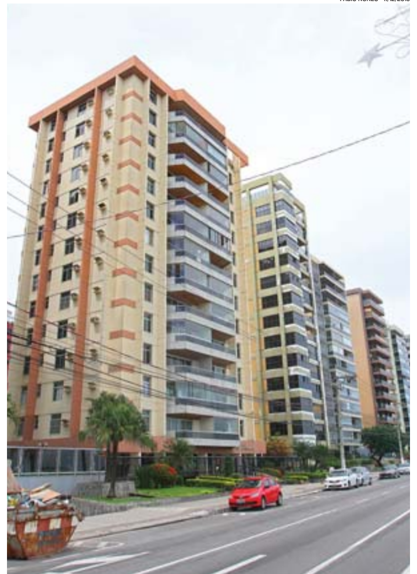
IMÓVEIS NA MATA DA PRAIA: metro quadrado custa R$ 5.732 no bairro

26,19% é a valorização na Mata da Praia R$ 5.402 custa o m 2 em Barro Vermelho