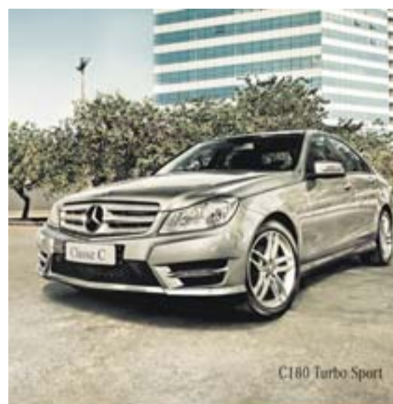
C180 Turbo Sport

Isso porque os juros no ato da assinatura do contrato já são calculados até o final e embutidos nas prestações e, se o financiamento for longo, vai tornar a prestação de três a quatro vezes maior do que o comprador imaginaria como parcelas iniciais.